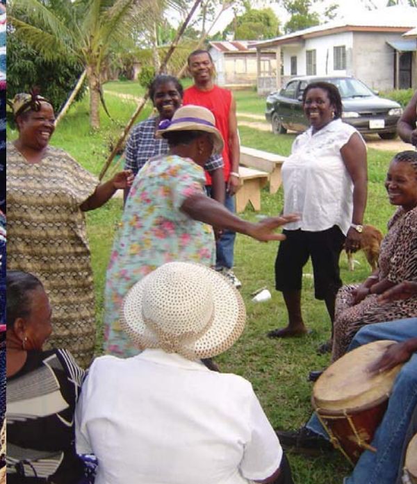
Language, Dance and Music of the Garifuna